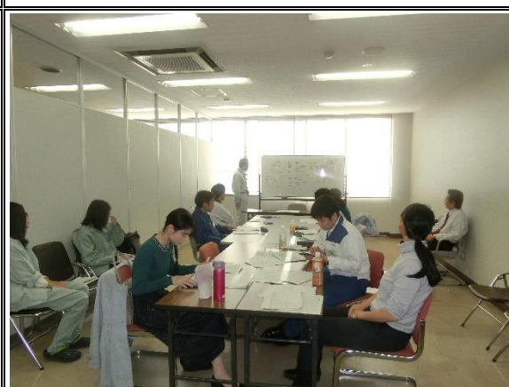
分析結果についての意見交換